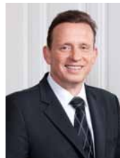
ŽUPANOV UVODNIK Čas spominov, načrtov in čarobnosti